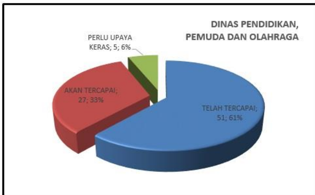
Gambar 2.3 Capaian Kinerja Dinas Pendidikan, Pemuda dan Olahraga Kab Temanggung