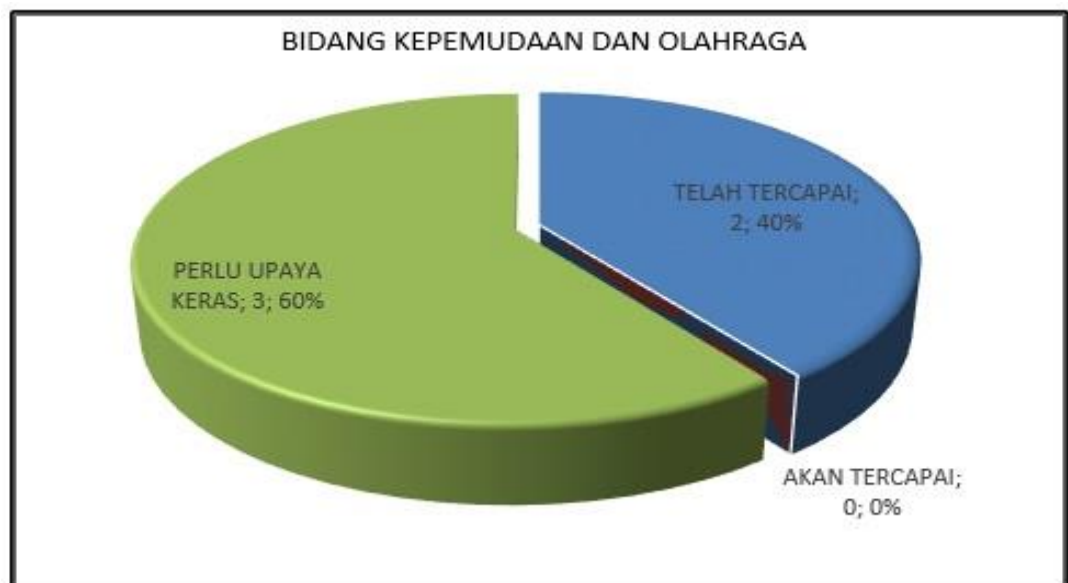
Gambar 2.2 Capaian Kinerja Urusan Pemerintahan Bidang Kepemudaan dan Olahraga